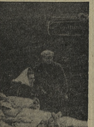
КРЫМСКАЯ ОБЛАСТЬ. С наступлением весенних дней в колхозах и совхозах начался массовый сев яровых культур. На снимке: сев овса в колхозе имени Войкова Ленинского района.