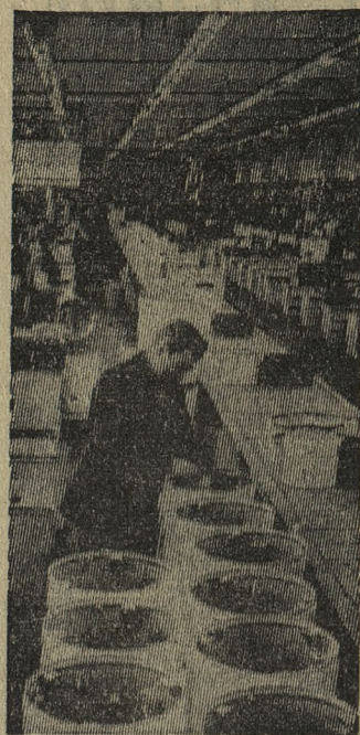
Завод «Хайдушэг», производящий бытовые приборы, построен в венгерском городе Дебрецене 15 лет тому назад. Его продукция — стиральные машины, полостиральные машины, пылесосы — пользуется известностью и за пределами страны. В 1968 году предприятие планирует выпустить 400.000 изделий.