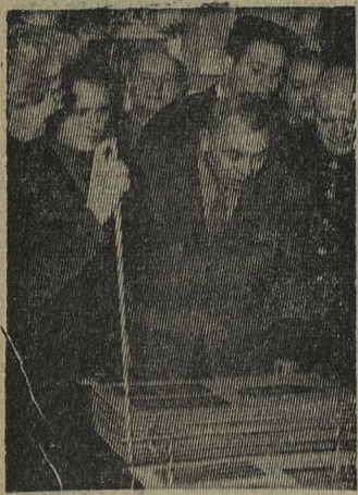
В музее Карла Маркса и Фридриха Энгельса в Москве.

НА СНИМКЕ: посетители знакомятся с фотографиями из альбома семьи К. Маркса.