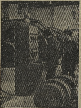
ЧЕЛЯВИНСКАЯ ОБЛАСТЬ. На сатинском заводе «Магнетит» коллектив треста «Южуралметаллургстрой» сооружает комплекс цеха № 2 магнетитовых изделий. Он должен вступить в строй в 1968 году и будет давать 280 тысяч тонн огнеупоров в год.

НА СНИМКЕ: готовится и пуску новая компрессорная.