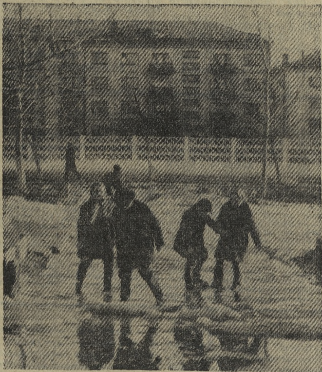
Долгожданная весна пришла!