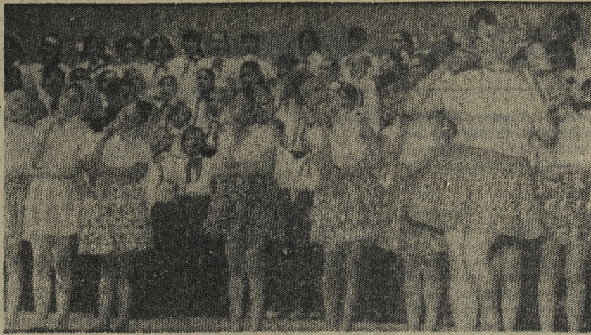
Закончился смотр художественной самодеятельности школ города. Много было разнообразных номеров. Хорошо подготовились ребята. На снимке справа — с вокально-хореографической композицией выступает хор школы № 2. Зрители внимательно слушают (слева).