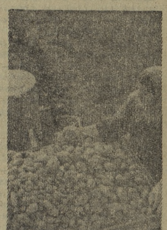
АЗЕРБАЙДЖАНСКАЯ ССР. Приступили к посадке картофеля (на снимке) труженики совхоза № 1 Таузского района. Под этой культурой в хозяйстве будет занято 450 гектаров.