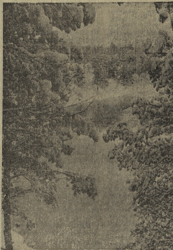
Первый день весны.