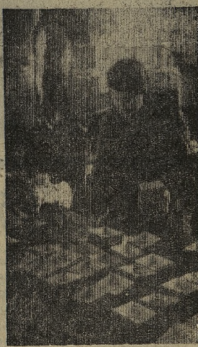
САРАТОВ. Почти 26,5 миллиона гектаров в 50 областях, краях и республиках засеивается сортами яровых пшениц, введенных в научно-исследовательском институте сельского хозяйства Юго-Востока.