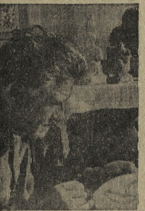
Венгерский скульптор Михай Пал создает барельеф капитана Штейнмеца. Мемориальная доска советскому герою, отдавшему жизнь при освобождении Будапешта, будет установлена в Дьёмре (область Пешт). В декабре 1944 года окруженные немецко-фашистские войска отвергли гуманный призыв советского командования пощадить город, сохранить его материальные и культурные ценности. Они расстреляли советских парламентариев капитанов Остепенко и Штейнмеца.