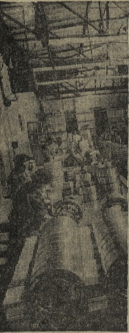
РУМЫНИЯ. С помощью Советского Союза построен подшипниковый завод в Бырладе. Сейчас предприятие производит 180 типов подшипников для автомашин, тракторов, электромоторов, нефтяного оборудования. Его продукция экспортируется в 30 с лишним стран. Коллектив завода поддерживает связь с Московским первым государственным подшипниковым заводом.