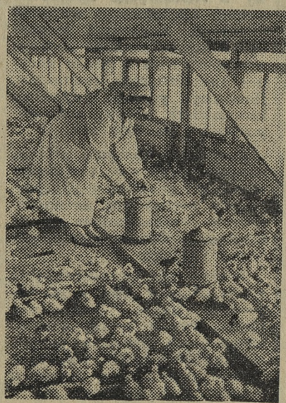
С фотоаппаратом по родной стране

Эстонская ССР. Совхоз «Ярлепа» — крупнейшее в республике хозяйство племенно- го птицеводства, в котором раз- водятся все виды домашней птицы. Здесь насчитывается 15.000 уток пекинской породы, второе по сравнению с прошлым годом увеличилось количество индеек. Их теперь 5.400, а уха- живают за ними всего два ра- ботника.