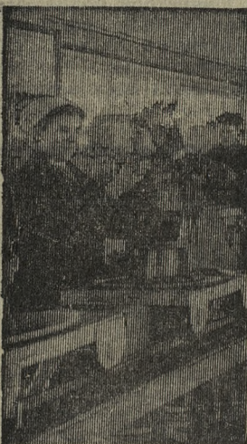
Мастерские Пензенского зонального отделения «Сельхозтехника» ведут капитальный ремонт тракторов «ДТ-54», восстанавливают тракторные гидроагрегаты для навесных орудий и топливные насосы.

К выводу в поле коллектив обязался отремонтировать 300 тракторов. Работы ведутся с опережением графика. На снимке: участок ремонта топливных насосов на потоке.