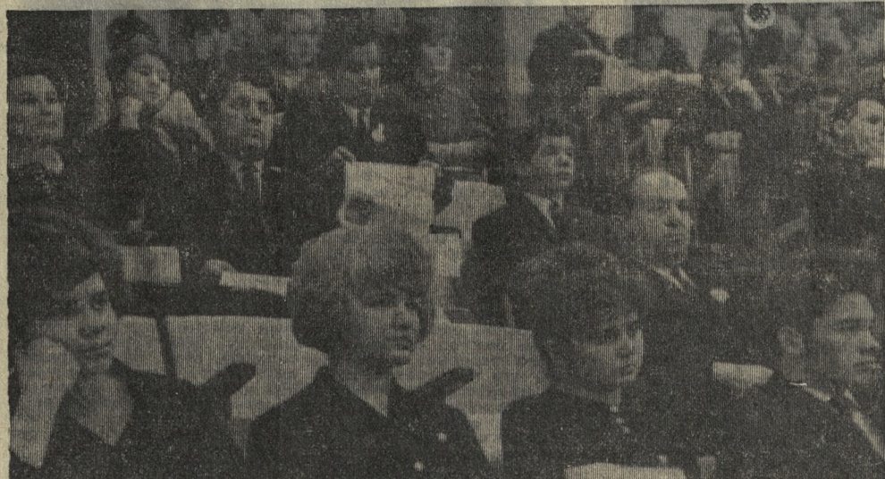
В зале конференции.

Нет для комсомольцев задачи более почетной, чем осуществление предначертаний Коммунистической партии. И в решении этой задачи, в революционном преобразовании мира каждый комсомолец должен определить свое конкретное место.