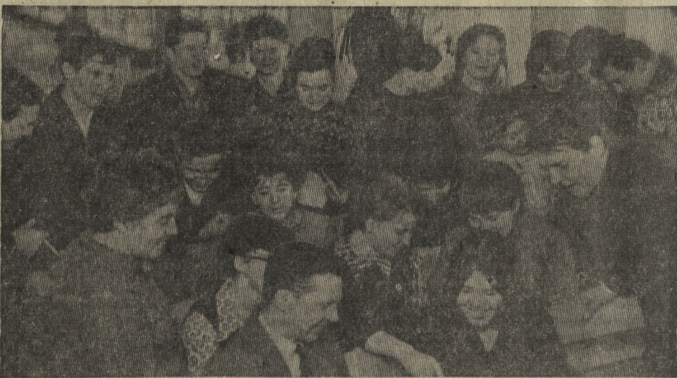
Там, где молодежь, не может быть места скуке. Это, конечно, не легко — управлять полустыльным отрядом комсомольцев. Но если их вожаки веселые, задорные, инициативные, как вот хромиковцы, что на этом снимке, то дела идут хорошо.

2 стр. «ПОД ЗНАМЕНЕМ ЛЕНИНА» 13 января 1968 г., № 10