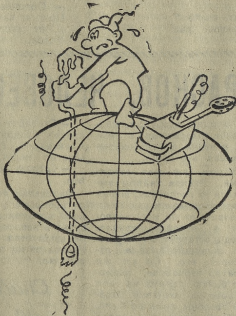
Рисунок В. ШМОТИНА.