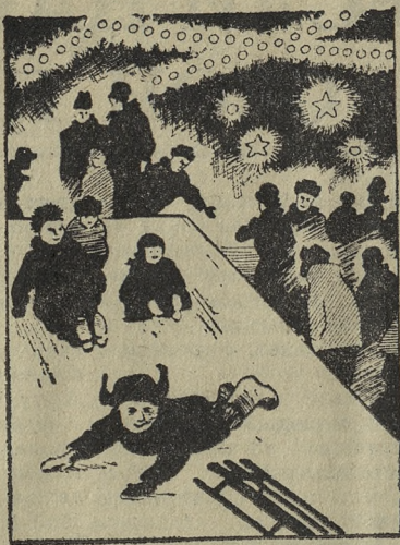
Рисунок М. СКАТИНА.

С ледяной горки непрочь прокатиться не только ребята, но и взрослые.