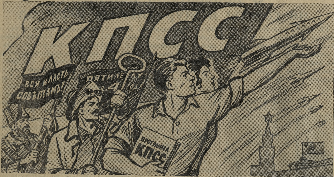
Рисунок В. Жаринова.