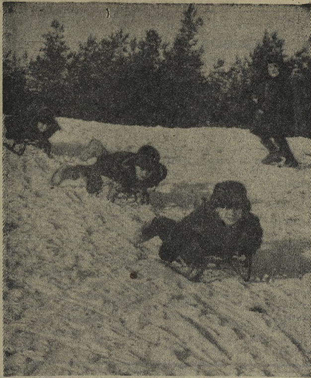
Хороша зима морозная!