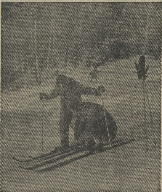
В погожий зимний день.