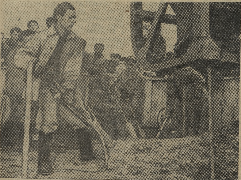
КРАСНОЯРСКИЙ КРАЙ. Строители крупнейшей в мире Красноярской ГЭС ведут укладку первого бетона в тело плотины ГЭС.