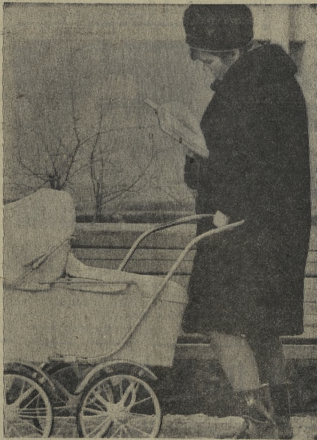
Пока малыш спит.