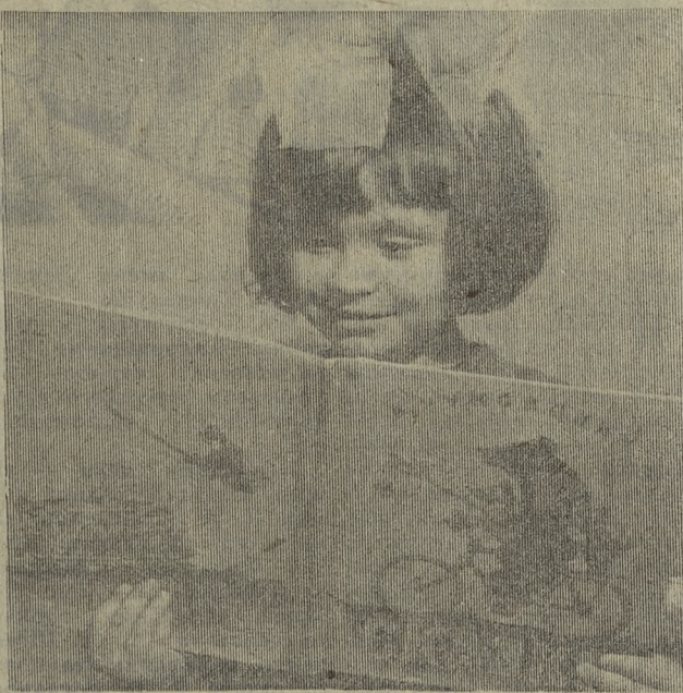
Любимая книжка.