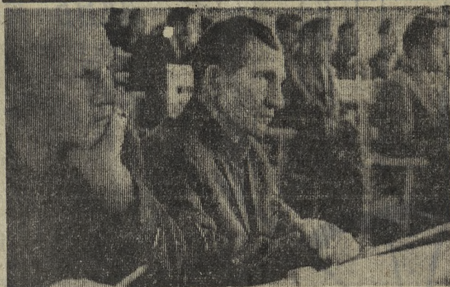
Первое занятие в школе основ марксизма-ленинизма второго года обучения на хромпиковом заводе.