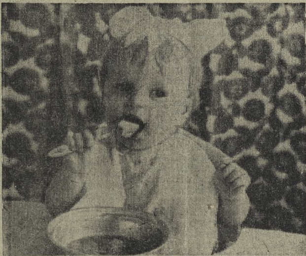
Вкусный сегодня обед!