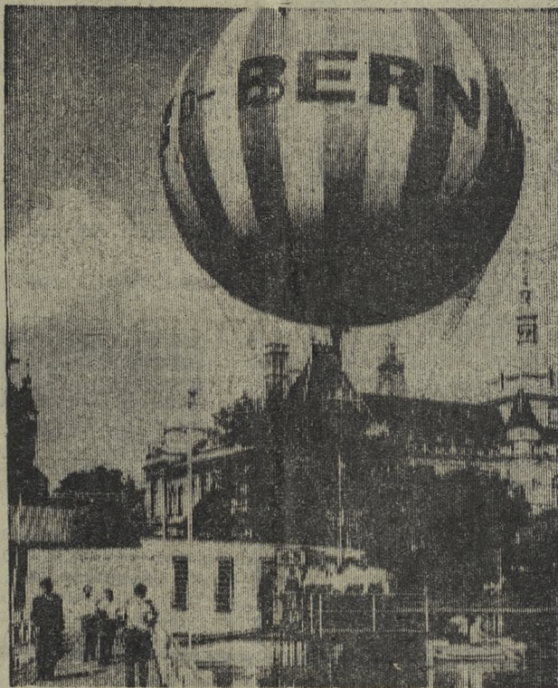
Яркий воздушный шар с надписью «Бернина 2» поднялся в голубое будапештское небо. На борту «корабля», полетевшего из городского парка в окрестности столицы, находился мешок с почтой. Этим интересным событием было отмечено открытие Международной выставки авиационных марок.