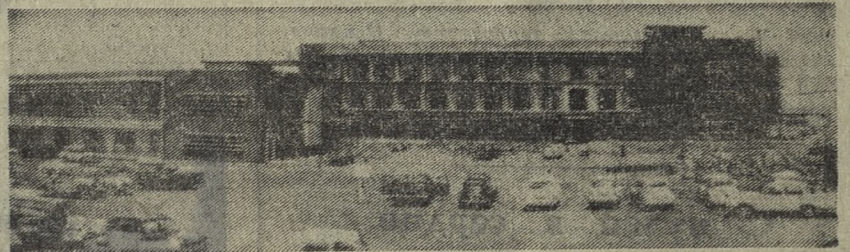
Панорама строительства госпиталя в кенийском городе Кисуму. Этот госпиталь сооружается в качестве дара Советского правительства правительству и народу Кении.