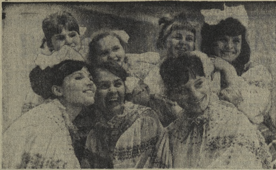
Это участницы народного ансамбля песни и пляски «Лявониха», работницы минского тракторного завода. Концерт, как всегда, прошел успешно, девушки довольны. С жизнерадостным искусством ансамбля знакомы многие города страны, в которых гастролировал самодеятельный коллектив.