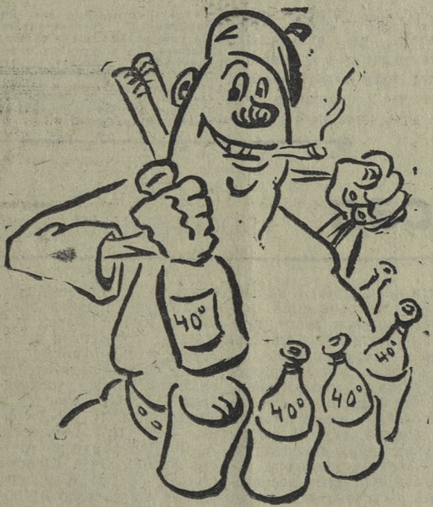
Подготовился к открытию охотничьего сезона. Рисунок В. ШМОТИНА.

— Я народный контроль, — говорит она гордо. — А вы кто? Никто! Я вас выведу на чистую