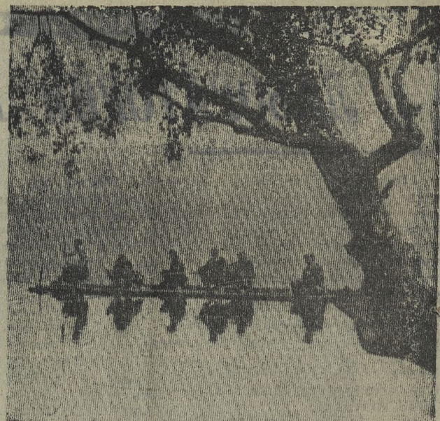
Рыбаку ничего не страшно — ни холодный пасмурный день, ни дождливое небо. Ну, а если нет времени съездить на дальние озера, он берет удочки и отправляется на городской пруд. Хоть часок посидеть, а все ж рыбалка.