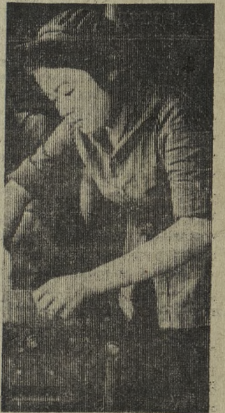
Заводы и фабрики Демократической Республики Вьетнам в трудных условиях войны увеличивают производство продукции.

На снимке: сборка машин на одном из предприятий в провинции Тхань-хоа.