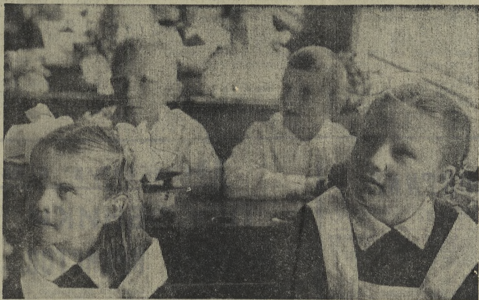
Вот и наступил долгожданный первый урок. Его с нетерпением ждали и эти девочки из школы № 12.

И. КРИВИЦКИЙ, нештатный инспектор госторговли.