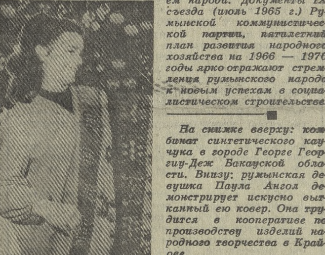
На карте страны показаны новые города — Георгиев, Виктория, Урикань. Возмше перемены произошли и на селе. Еще в 1962 году было завершено кооперирование сельского хозяйства. Возросла техническая оснащенность сельскохозяйственного производства, увеличился валовой сбор зерновых, производств мяса, молока и других продуктов. Возросли доходы кооперативов. Непрерывно повышается благосостояние трулящихся. Образование, наука и культура стали достоянием народа. Документы IX съезда (июль 1965 г.) Румынской коммунистической партии, пятилетний план развития народного хозяйства на 1966 — 1970 годы ярко отражают стремления румынского народа к новым успехам в социалистическом строительстве.

Торжественно отмечает румынский народ свой большой национальный праздник — День освобождения от фашистских захватчиков. Победа вооруженного восстания в августе 1944 года открыла путь к новой жизни и строительству социализма. Аграрная в прошлом страна выдвинулась в число передовых европейских государств с развитой промышленностью и механизированным сельским хозяйством. Индустрия стала ведущей отраслью в народном хозяйстве страны.