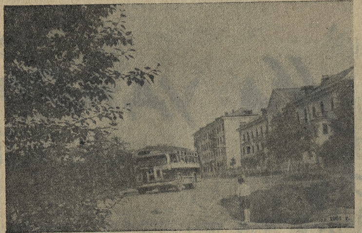
Первоуральск. Улица Ленина.