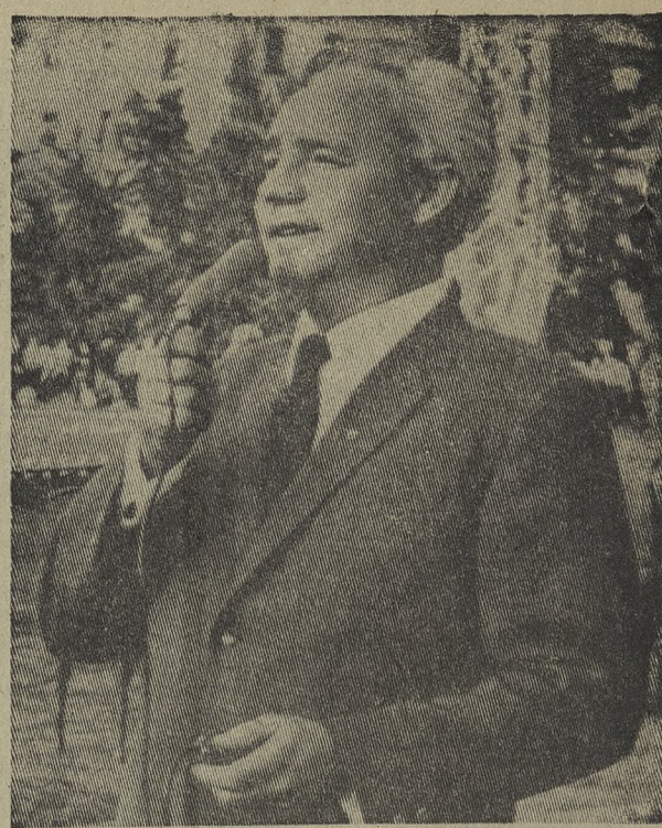
За редактора Б. И. ПРУЧКОВСКИЙ.