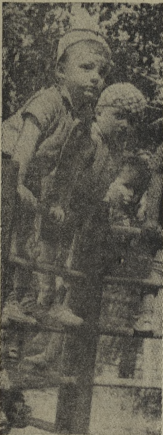
ДОЗОРНЫЕ.