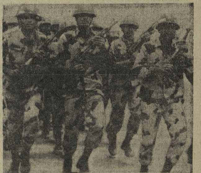
Вооруженные силы Объединенной Арабской Республики ведут бой против вторгшихся на территорию Республики войск Израиля.