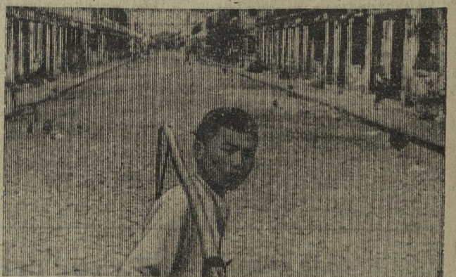
Макао (Аомынь), колонияльное владение Португалии, расположено на побережье Южно-Китайского моря в устье реки Сицзян. Включает в себя Макао, о-ва Тайпа и Колоане. Основную массу населения Макао составляют китайцы. В 1951 году Макао по- лучил статус «заморской территории» Португалии. На снимке: здесь живет бедный люд порта Макао. 3 стр. «ПОД ЗНАМЕНЕМ ЛЕНИНА» 14 июня 1967 г., № 117