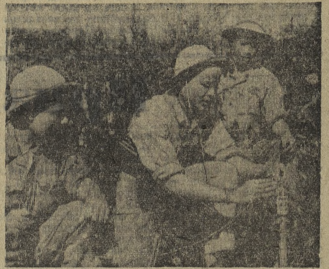
Южный Вьетнам. Бойцы Армии освобождения учатся минному делу

Работы и теперь еще по горло: необходимо ставить горелки, делать притирку всех задвижек и