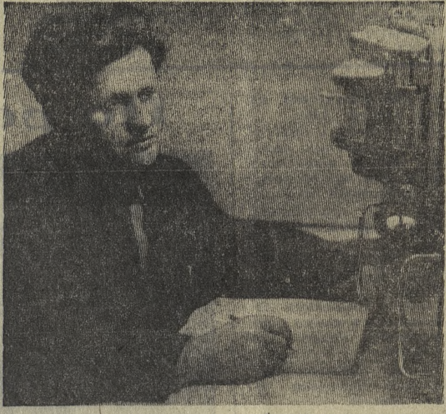
Фото и текст Ю. ДУНАЕВА, члена фотоклуба при редакции газеты «Под знаменем Ленина».

Коллектив, которым руководит Леонид Антонович, носит почетное звание бригады коммунистического труда.