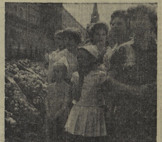
МОСКВА. 8-е мая. Торжественное открытие памятника «Могилы Неизвестного солдата» с Вечным огнем славы. На правом снимке: у Кремлевской стены после открытия памятника.