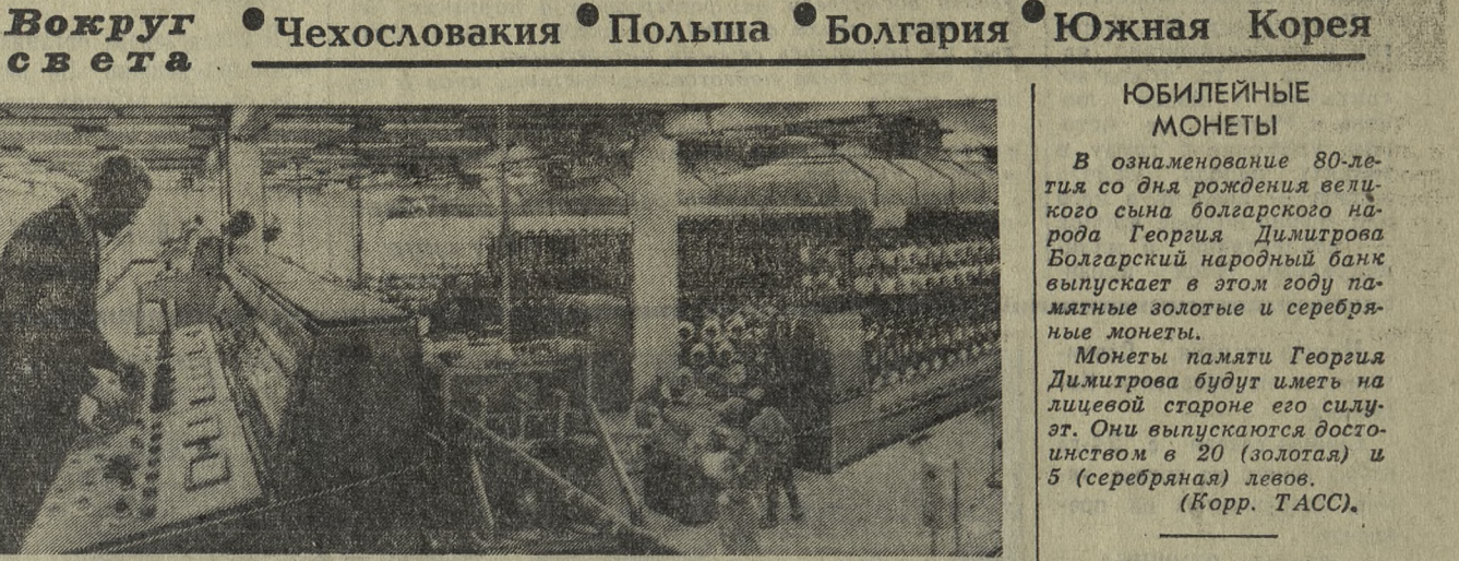
Вокруг света • Чехословакия • Польша • Болгария • Южная Корея

Всю жизнь памятью будет. Вот как рассуждает наш постоянный рабочий. Да, моральное поощрение — сила — и иногда забывать начали кое-где напрасно. Почему у нас не практикуется, например, так: в конце смены к бригаде пошел бы мастер и сказал: «Хорошо поработали, товарищи, спасибо. Желаю хорошего отдыха!» И люди бы довольные пошли со смены. Или на оперативке мастер отметил бы особо отличившихся вчера. Плохо ли это? Нет, думается, что было бы хорошо.