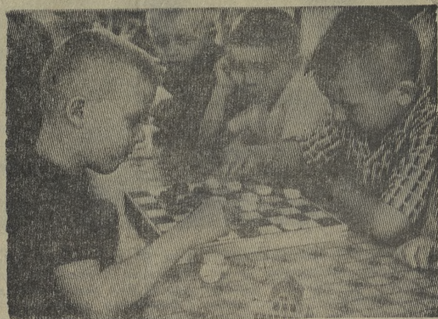
В новом детском саду № 91 растут будущие чемпионы шашечной игры.

Е. ШАПОВАЛОВА, директор кинотеатра «Космос».