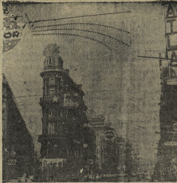
БЕЛЬГИЯ. В центре Брюсселя.

И в итоге каждый месяц пополняется цеховая копилка. В январе мы внесли в нее 11 тысяч рублей, в феврале — около восьми тысяч. А на 20 марта уже имеем 8500 рублей.