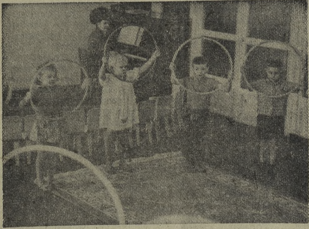
На территории Битимского сельсовета есть городской детский комбинат.

В феврале зима делает последние усилия: сыплет в окна домов колючим снегом, гуляет порывистым ветром, заметая вычищенные дорожки. Но все чаще появляется солнце, все приветливее улыбается оно своими лучами.