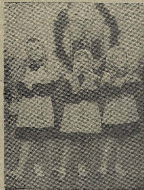
Текст З. Кормильцевой.

Согретая заботой партия и всего советского народа, растет надежная смена старшим. И верится, что, как сказано в проекте новой Программы Коммунистической партии Советского Союза, нынешнее поколение будет жить при коммунизме.