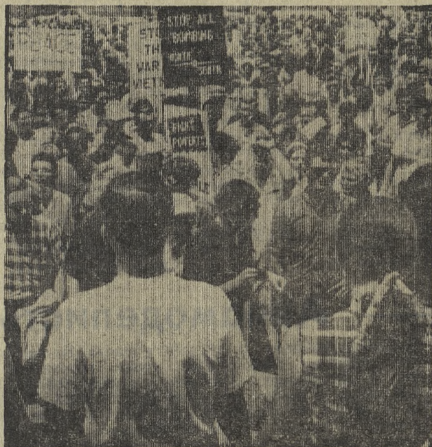
США. Жители Лос-Анжелоса собрались на митинг, чтобы заявить свой протест против агрессии во Вьетнаме.

«Мир», «Нет — напалму», «Прекратить бомбежки на севере и на юге» — призывают плакаты.