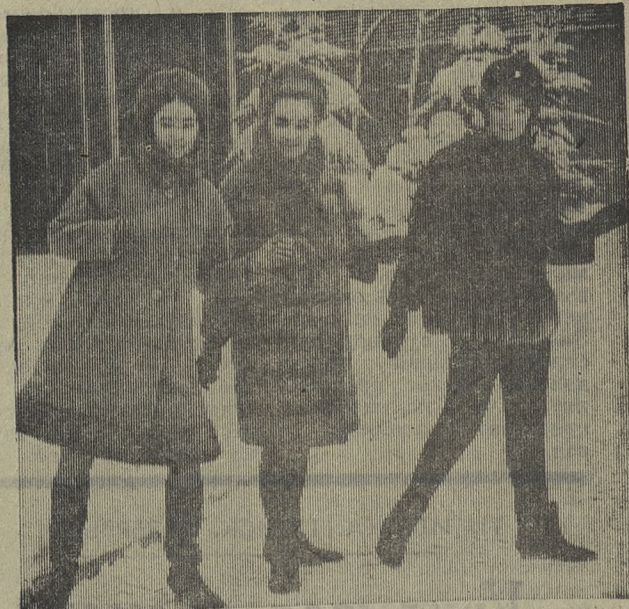
Москва. Крупный международный форум модельеров откроется летом будущего года в парке культуры и отдыха «Сокольники».

Международная выставка «Одежда» соберет искусных конструкторов платья, закройщиков, портных из многих стран.