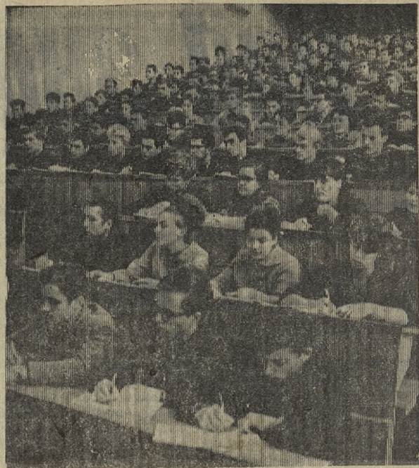
Минск. Белорусскому государственному университету исполнилось 45 лет. В настоящее время на 10 его факультетах обучается 4250 студентов. 750 человек, из которых 59 докторов и 260 кандидатов наук, ведут преподавательскую и научную работу.