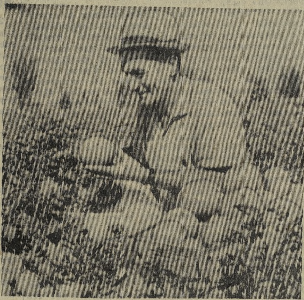
Первого сентября началась подписка на газеты и журналы