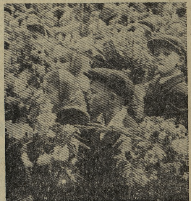
На торжественной линейке, посвященной началу нового учебного года, в школе № 32.

Сентябрь открыл первую страницу нового учебного года. В этот день за парты школ города и поселков села 27 с лишним тысяч мальчишек и девчонок.