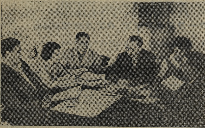
Львовский областной совет до недавних пор объединял шестнадцать обкомов профсоюзов. Теперь их стало на два больше. На общественных началах созданы обкомы профсоюза рабочих машиностроения и профсоюза рабочих электростанций и электропромышленности. В новых комитетах нет штатных работников. Здесь все обязанности выполняют общественники. На снимке: заседание президиума Львовского обкома профсоюза рабочих машиностроения.