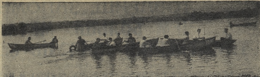
В воскресенье молодежь отдыхает на городском пруду.