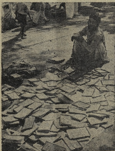
РЕСПУБЛИКА ИНДИЯ. Продавец книг на улицах Дели.

Заседание судейской коллегии совместно с представителями 19 июля, в 19 часов, в помещении горспортсоюза (Чкалова, 46).