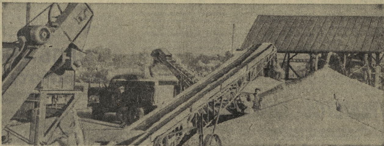
Краснодарский край. На центральной усадьбе колхоза «Родина» Павловского района вот уже второй год работает самый крупный на Кубани механизированный ток. Сюда поступает хлеб от всех восьми бригад, здесь он обрабатывается и доводится до товарных и семенных кондиций. На ток работают сортировочные машины, автоподъемники, ленточные транспортеры, механические погрузчики. 900 тонн зерна в сутки — такова производительность механизированного тока. На снимке: на механизированном колхозном току.