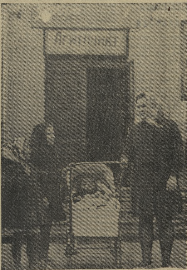
Пока мама с папой голосуют.

С. ДАНИЛЕНКО, начальник конструкторского бюро, общественный корреспондент.