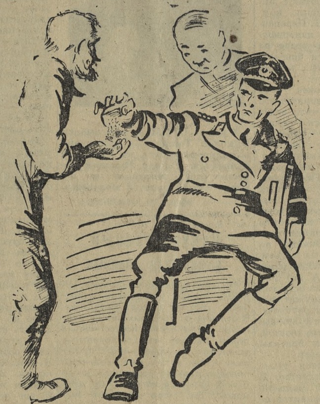
Рис. М. СКАТИНА.