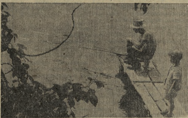
Вместе с папой.