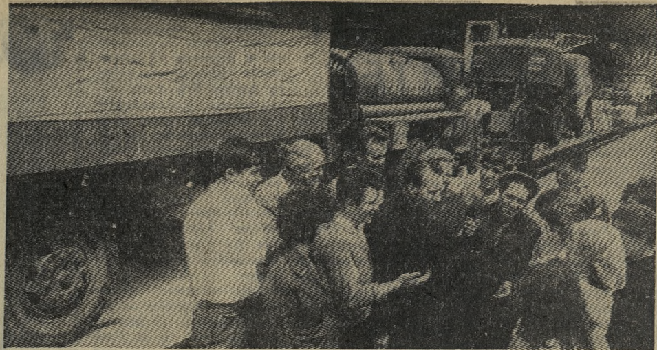
Одесса. Отсюда для оказания братской помощи населению Ташкента, пострадавшего от землетрясения, выехал большой отряд строителей из южных областей Украины — Одесской, Никопольской, Херсонской, Крымской. Вместе с ними отправлен железнодорожный состав с инструментами и строительной техникой.