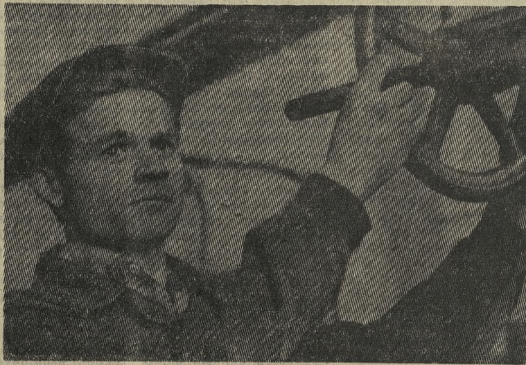
Борис ПАСТУХОВ, секретарь ЦК ВЛКСМ

только за последние четыре года. Изменение, внесенное в Устав КПСС на XXIII съезде о приеме в партию молодежи до 23 лет только через ВЛКСМ, показывает, что политическое влияние комсомола неуклонно повышается, он является резервом партии, первым помощником и проводником ее идей. Так на деле осуществляется преемственность поколений отцов и детей, идущих в общем строю создателей коммунизма.